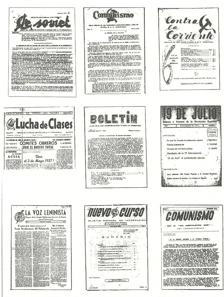
Diversas portadas de la prensa trotsquista (1936-1948).