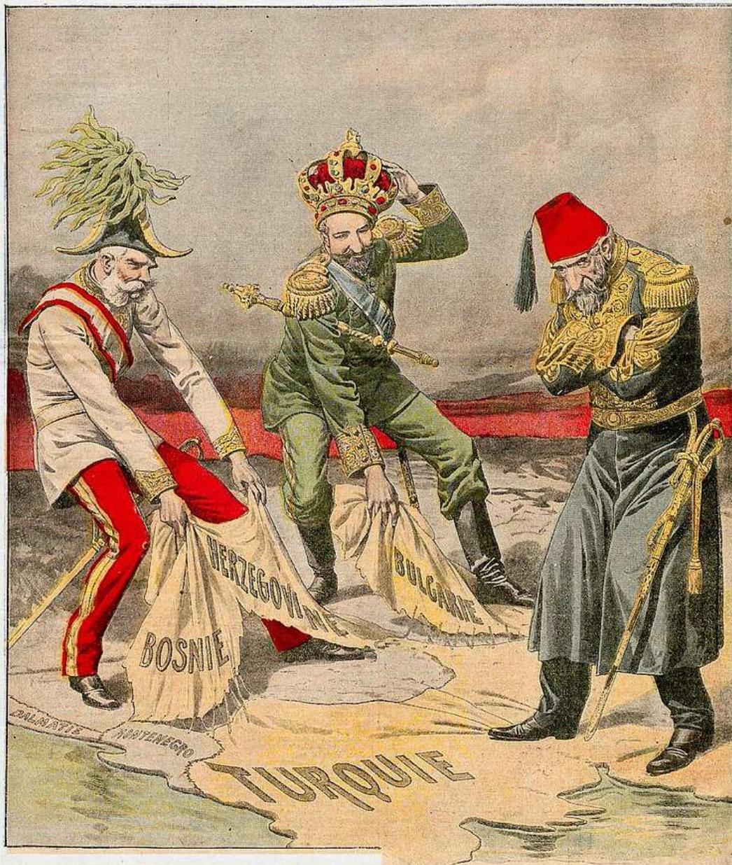
LE REVEIL DE LA QUESTION D'ORIENT La Bulgarie proclame son indépendance. -- L'Autriche prend la Bosnie et l'Herzégovine

Le Petit Journal 5 CENTIMES SUPPLÉMENT ILLUSTRÉ 5 CENTIMES ABONNEMENTS CHIQUE JOUR - 6 PAGES - 5 CENTIMES Administration : 61, rue Lafayette Les manuscrits ne sont pas rendus Dix-neuvième Année Le Petit Journal agricole, 5 cent. -- La Mode du Petit Journal, 10 cent. Le Petit Journal illustré de la Jeunesse, 10 cent. On s'abonne sans frais dans tous les bureaux de poste SIX MOIS UN AN SEINE et SEINE-ET-OISE... 2 fr. 2 fr. 50 DÉPARTEMENTS... 2 fr. 4 fr. » ÉTRANGER... 2 fr. 5 fr. » DIMANCHE 18 OCTOBRE 1908 Numéro 985