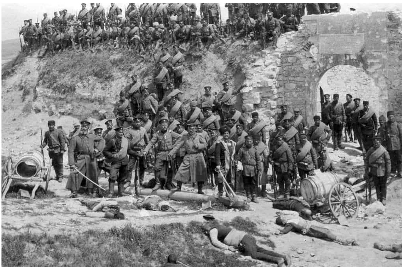
Soldados búlgaros posando en el fuerte de Ayvaz Baba, en las afueras de Adrianópolis, después de su captura