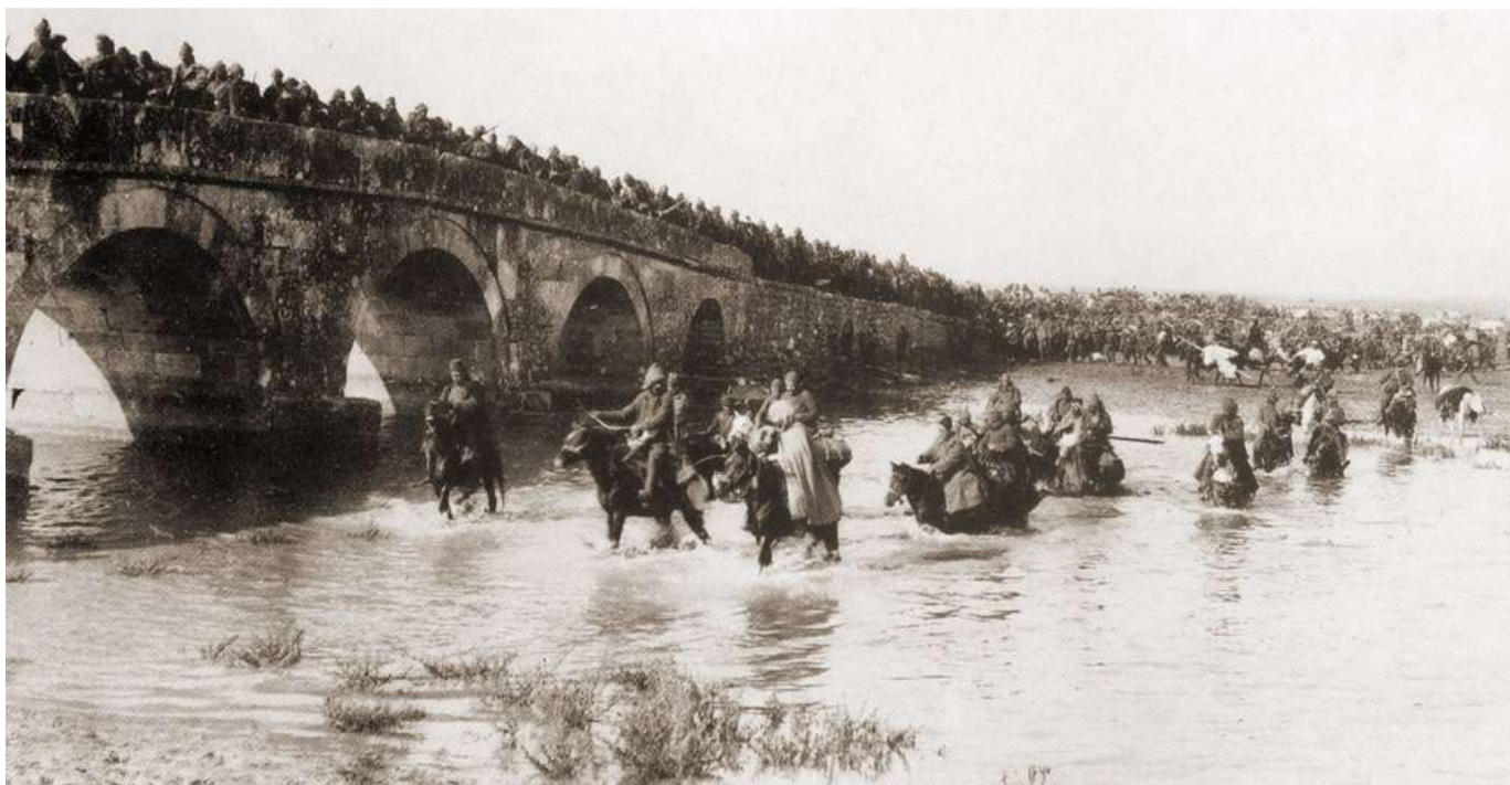
Retirada otomana, en Karisdiran, durante la batalla de Lule-Burgas