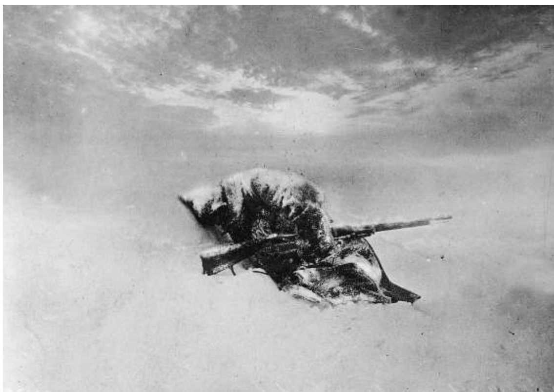
Centinela serbio congelado