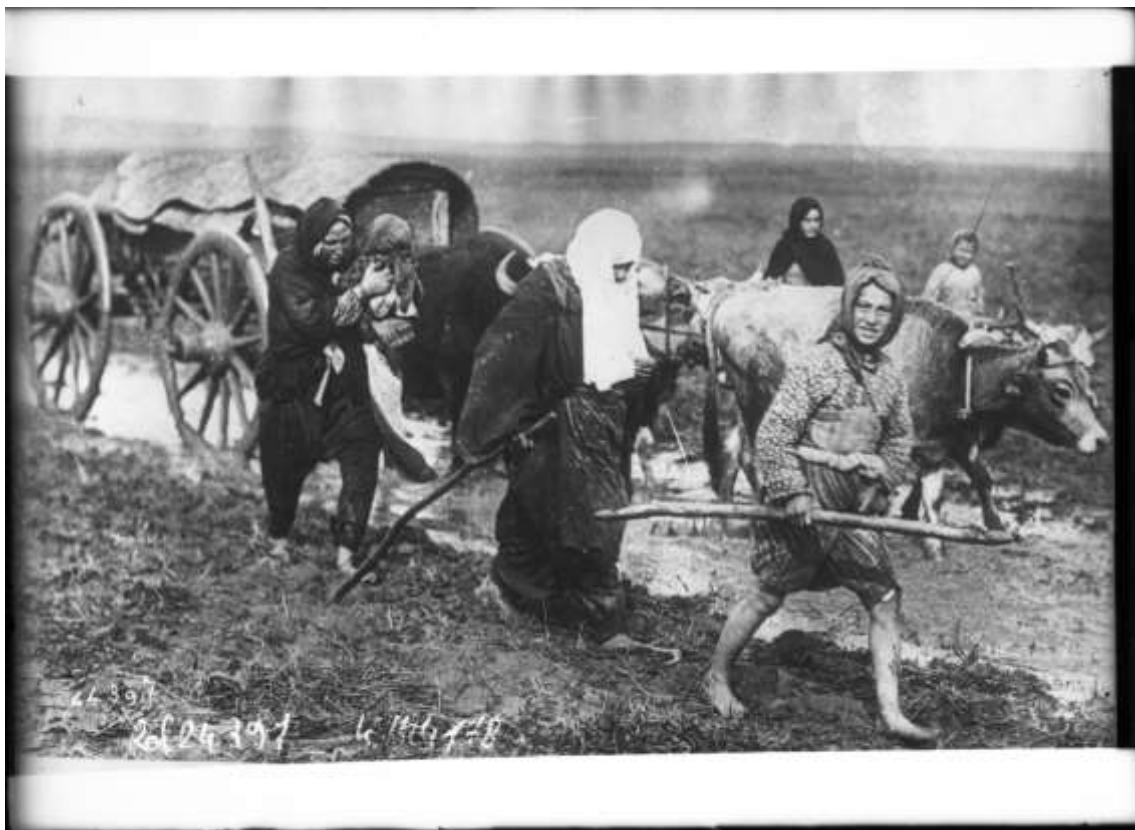
Civiles huyendo, Agencia Rol, 1912

Source gallica.bnf.fr / Bibliothèque nationale de France