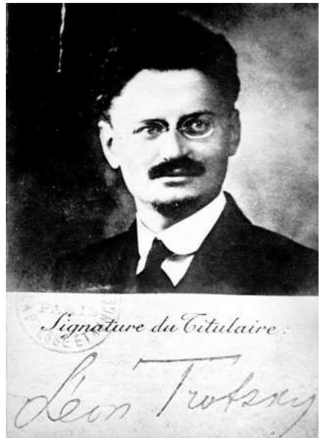
Trotsky en 1915, fotografía del pasaporte

Como lecturas complementarias recomendamos Resultados y perspectivas. Las fuerzas motrices de la revolución, 1905 , que permiten conocer los desarrollos del marxismo a que aludimos más arriba y La guerra y la Internacional , que permite estudiar la reacción ante la degeneración de la Segunda Internacional ante los preparativos de la primera guerra imperialista que se desató en 1914, de la que las guerras de los Balcanes fueron el prólogo.