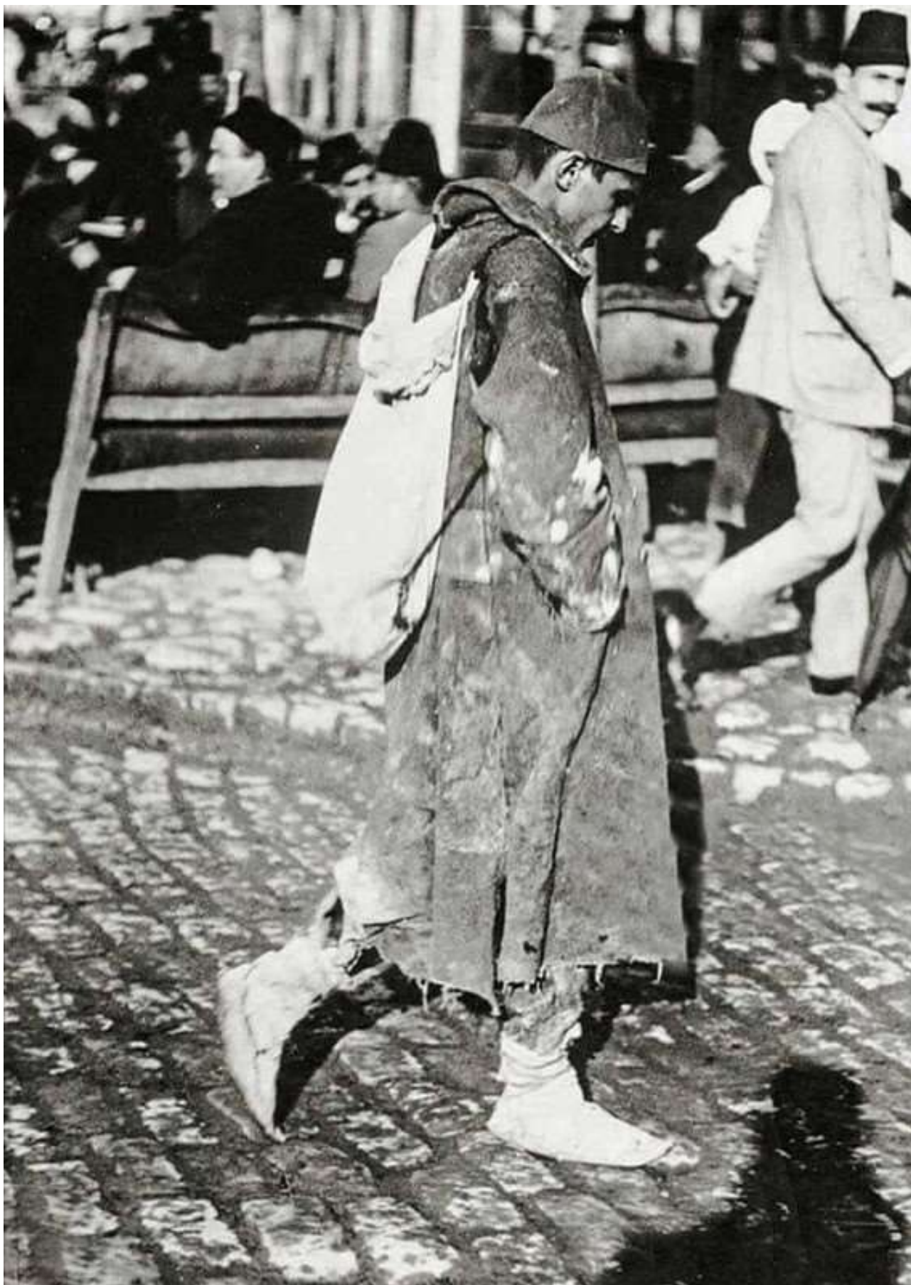
Soldado turco de regreso a casa, 1913