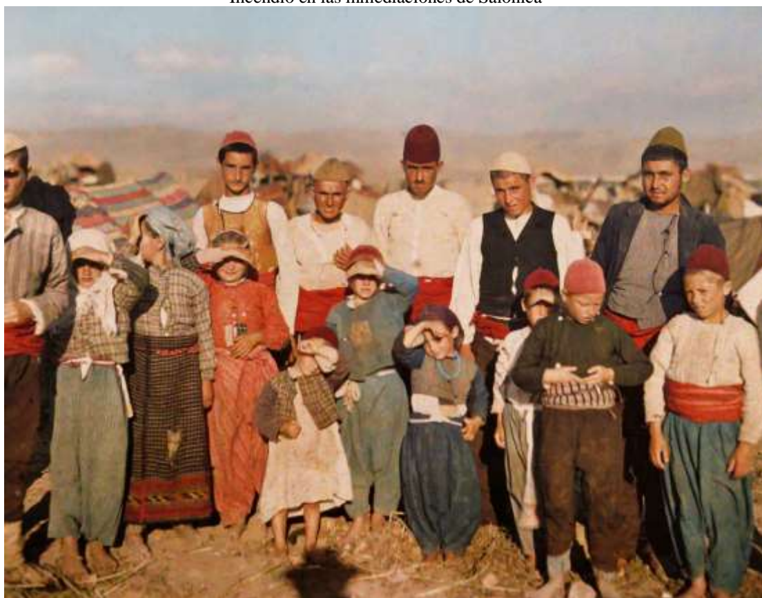
Refugiados turcos en Edirne