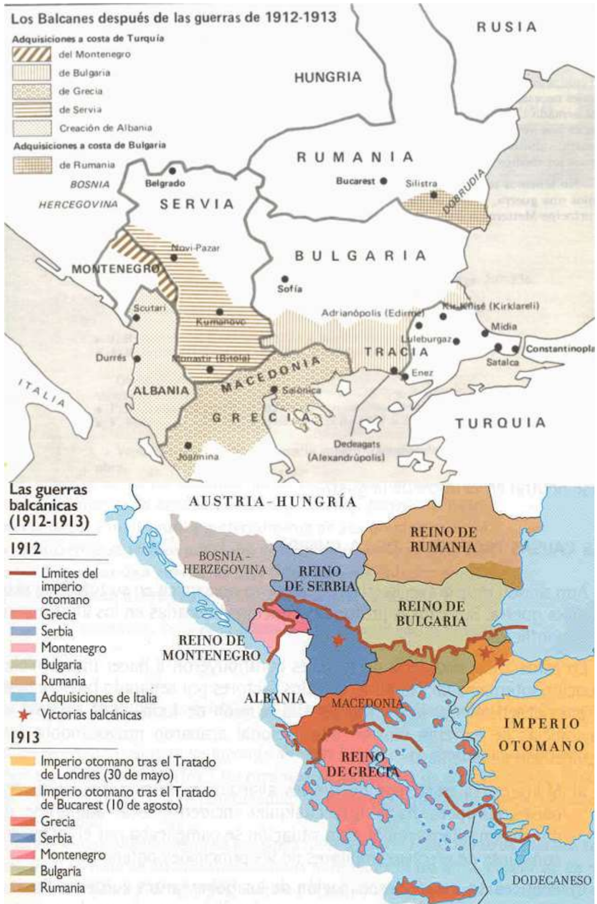
Los Balcanes durante y tras las guerras de 1912 y 1913, mapa