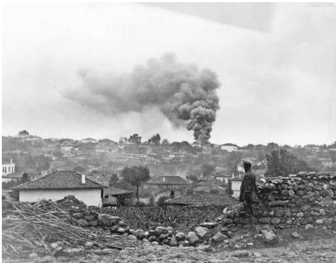
Incendio en las inmediaciones de Salónica