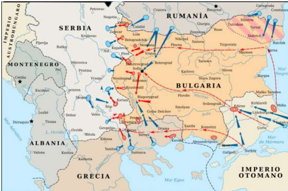
Segunda Guerra de los Balcanes, mapa. En rojo, movimientos y unidades búlgaras; en azul, movimientos y unidades serbias, griegas, rumanas y otomanas; Dobruja meridional a Rumanía (Tratado de Bucarest, 13/8/1913); - - -, fronteras resultado de la contienda