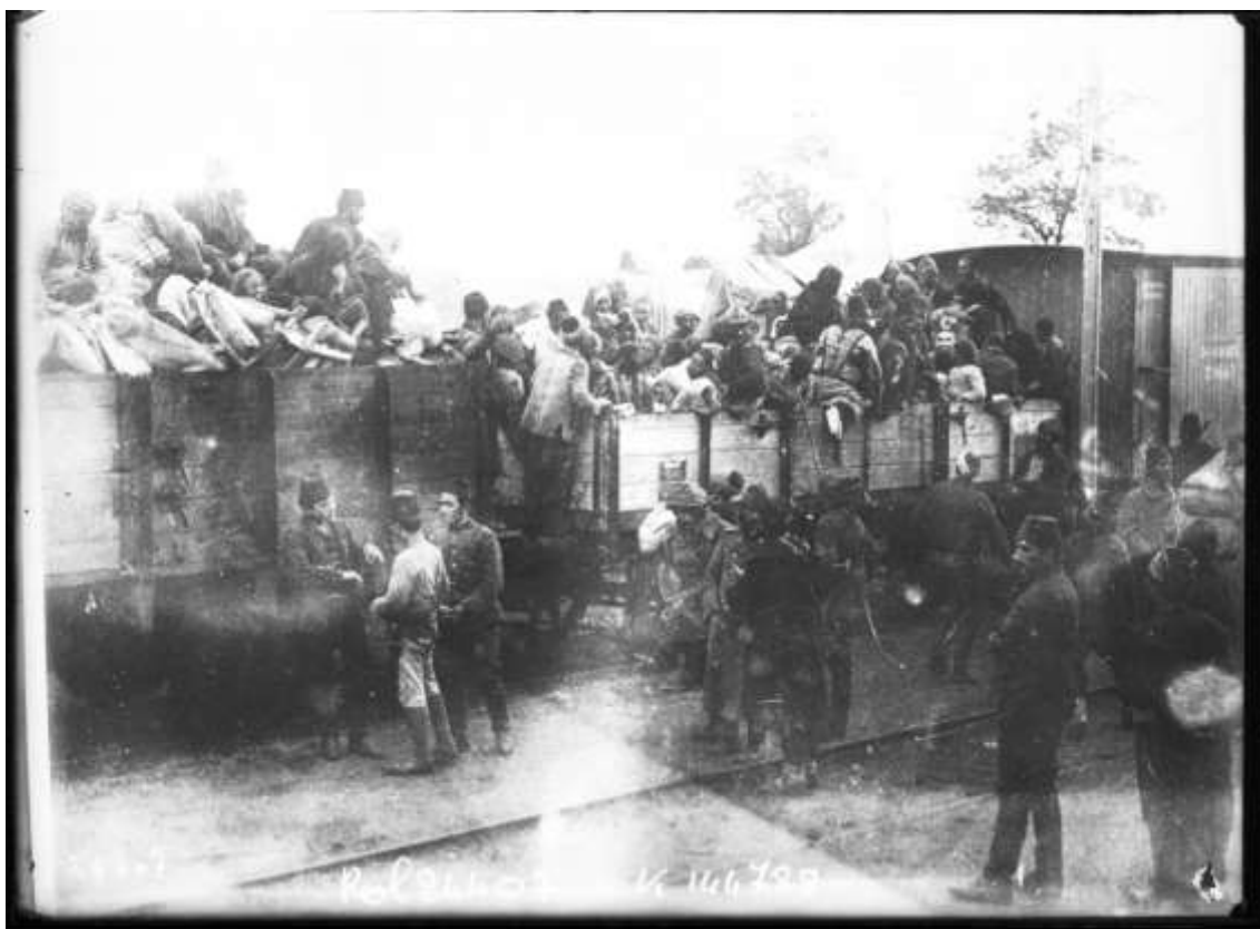
Mujeres huyendo, Agencia Rol, 1912

Source gallica.bnf.fr / Bibliothèque nationale de France