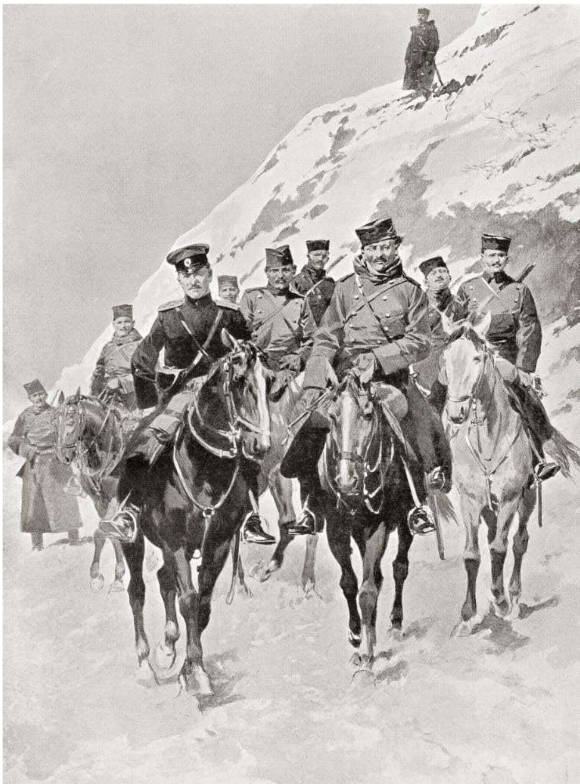
Caballería serbia en las guerras de los Balcanes 1912 - 1913