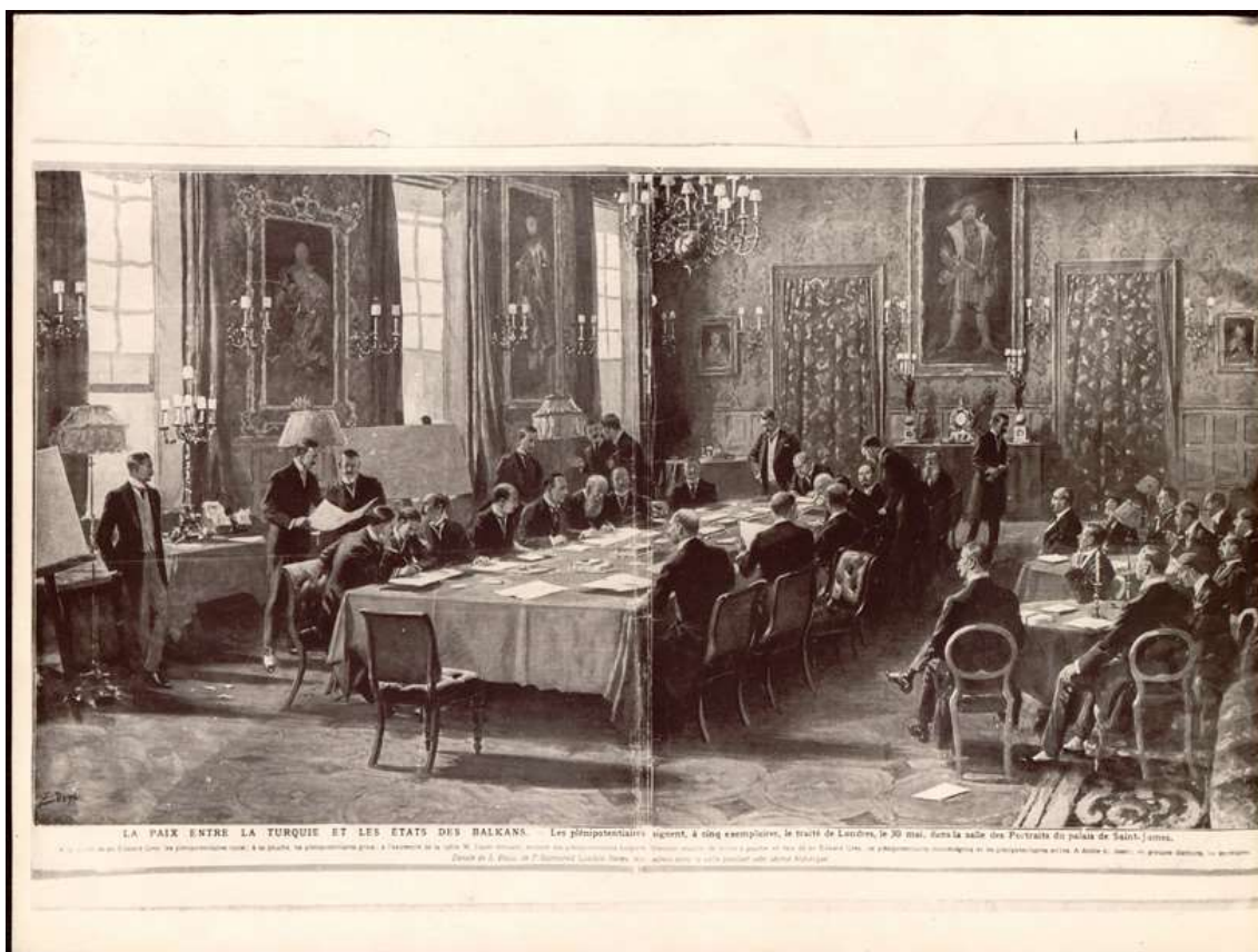
Firma en Londres del tratado de paz entre Turquía y los estados balcánicos, 30 de mayo de 1913