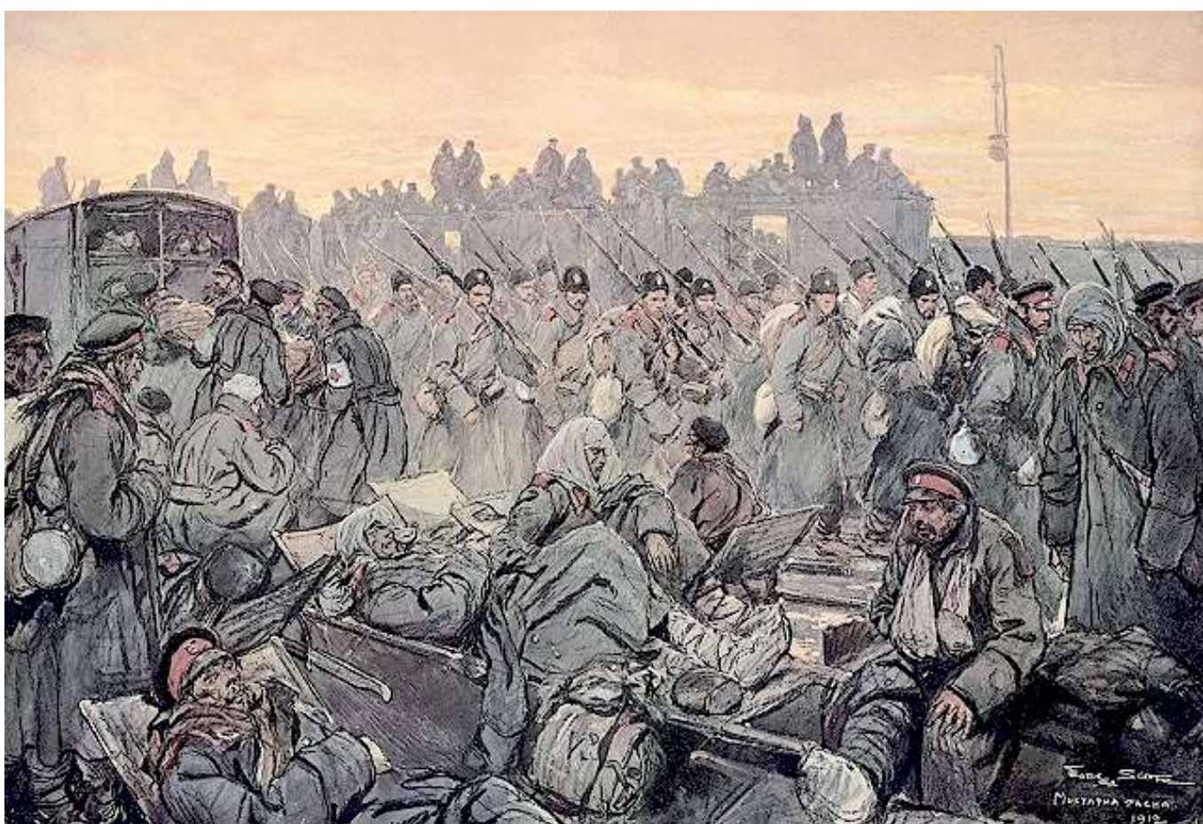
Relevo de tropas búlgaras en las acometidas a la línea defensiva otomana en Çatalca, que protegía la capital otomana