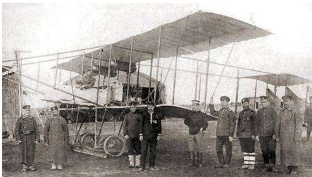
El avión Albatros, que realizó el primer vuelo de combate sobre Edirne el 16 de octubre de 1912