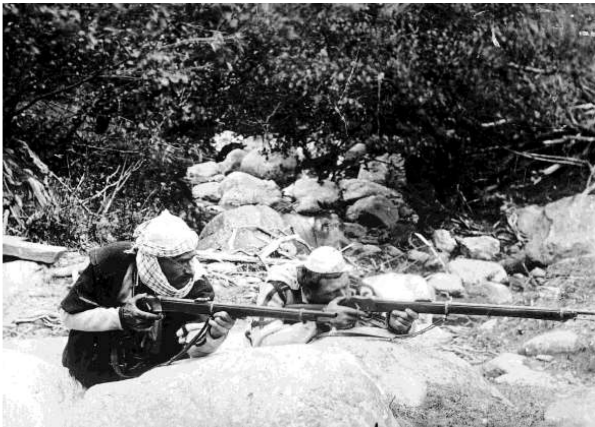
Los komitadži serbios operando en el territorio de la antigua Serbia, durante la guerra