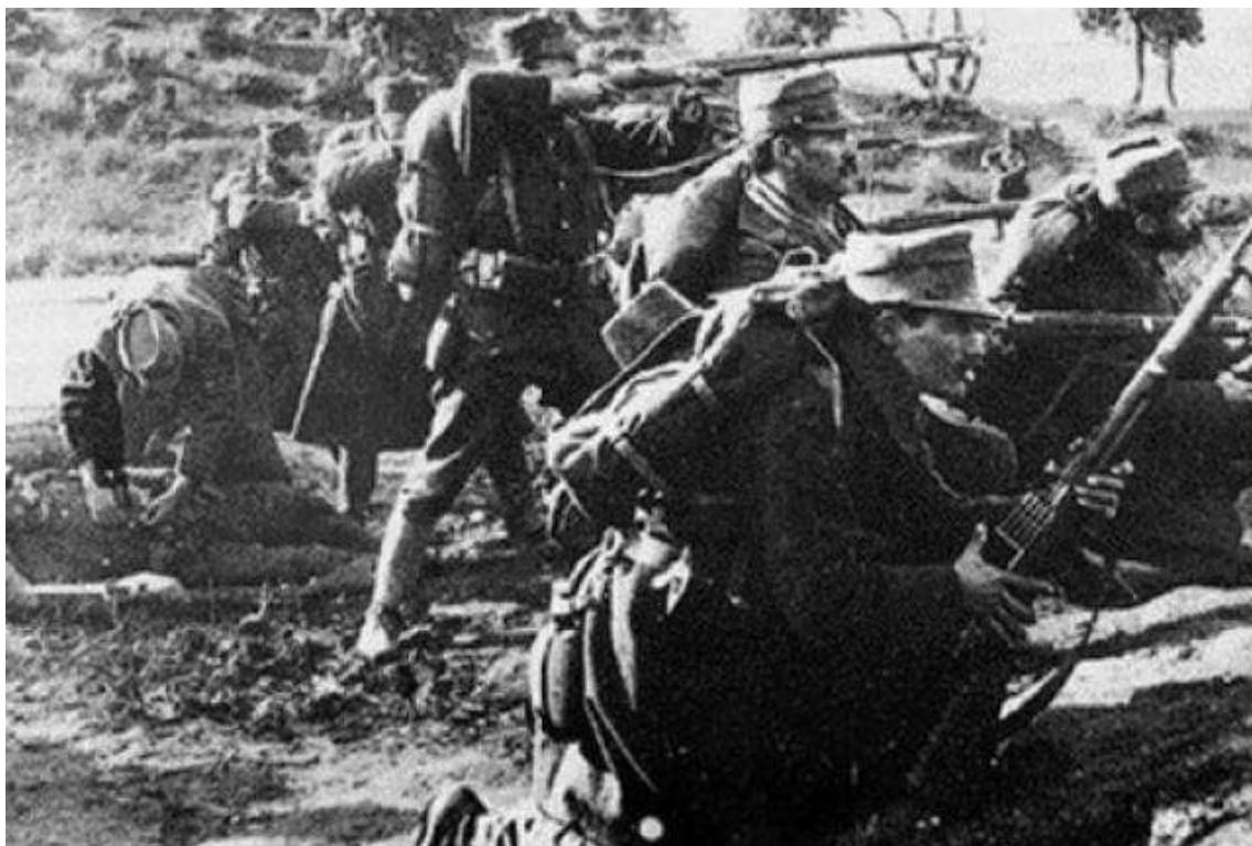
Infantería griega en la batalla de Sarantaporo