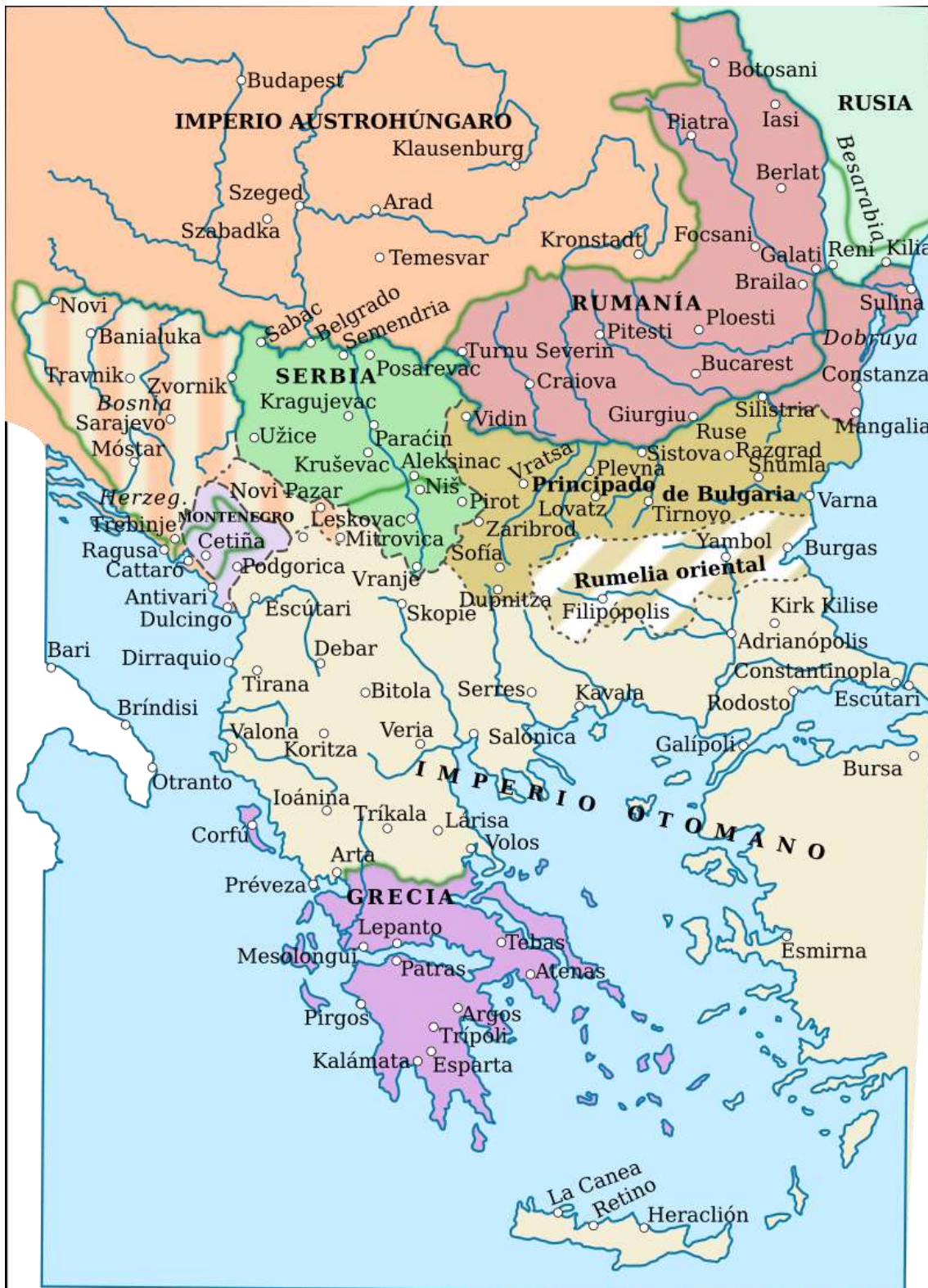
Los Balcanes tras el Tratado de Berlín de 1878, que supuso la pérdida otomana del norte de la región y el surgimiento de varios estados-nación que se disputaban territorios