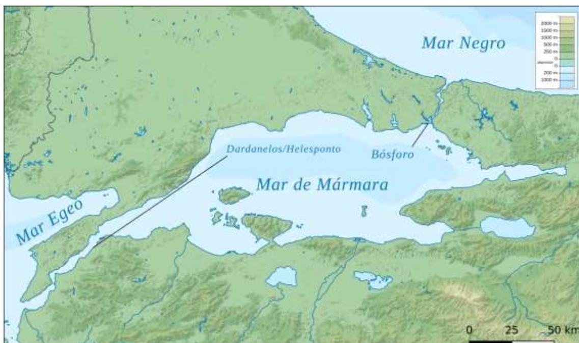
Los estrechos del Bósforo y de los Dardanelos, mapa físico