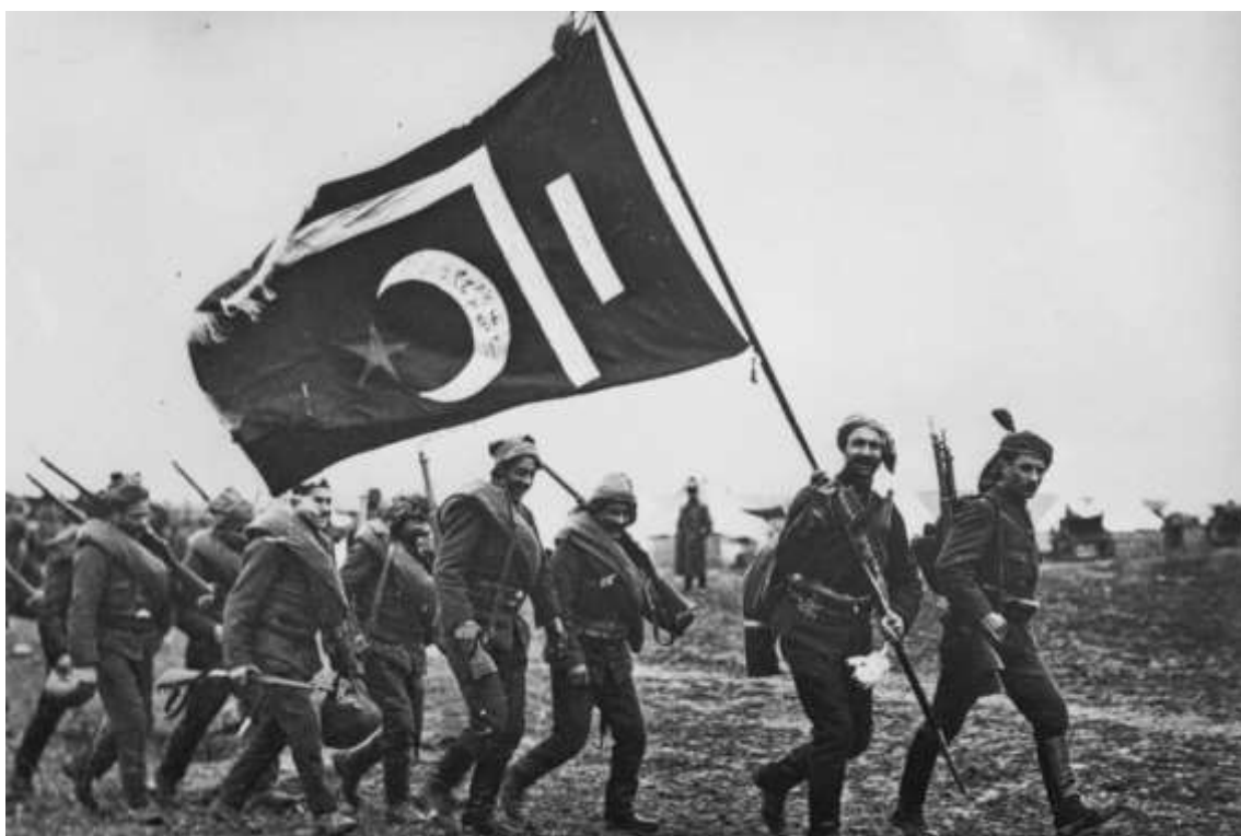
Abanderado del ejército otomano durante la primera guerra de los Balcanes

Soldados del Ejército Real de Montenegro, con sus banderas, descansando cerca de la confluencia de los ríos Taraboš y Skadra, cerca de Scútari, a principios de 1913