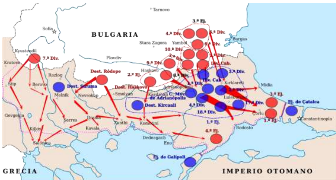
Principales operaciones militares búlgaras durante la contienda, mapa