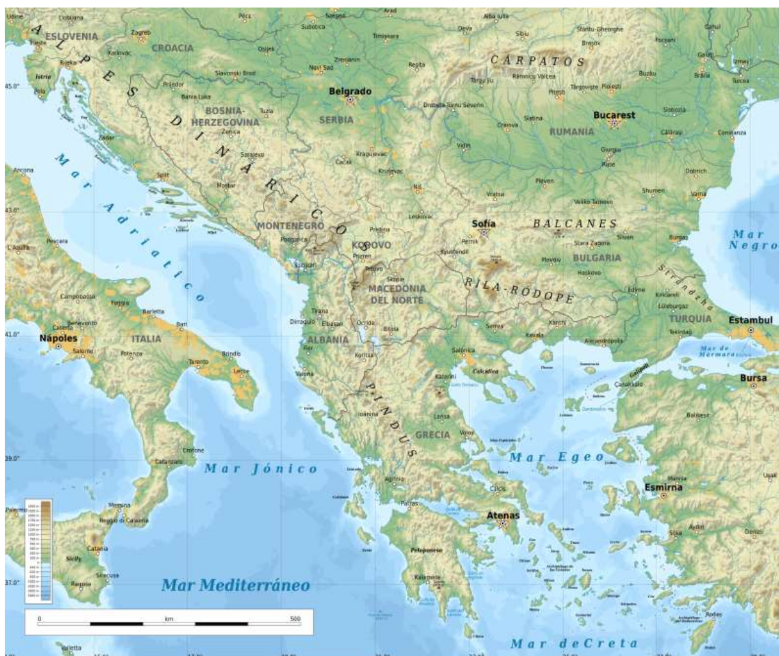
Mapa físico de la península de los Balcanes