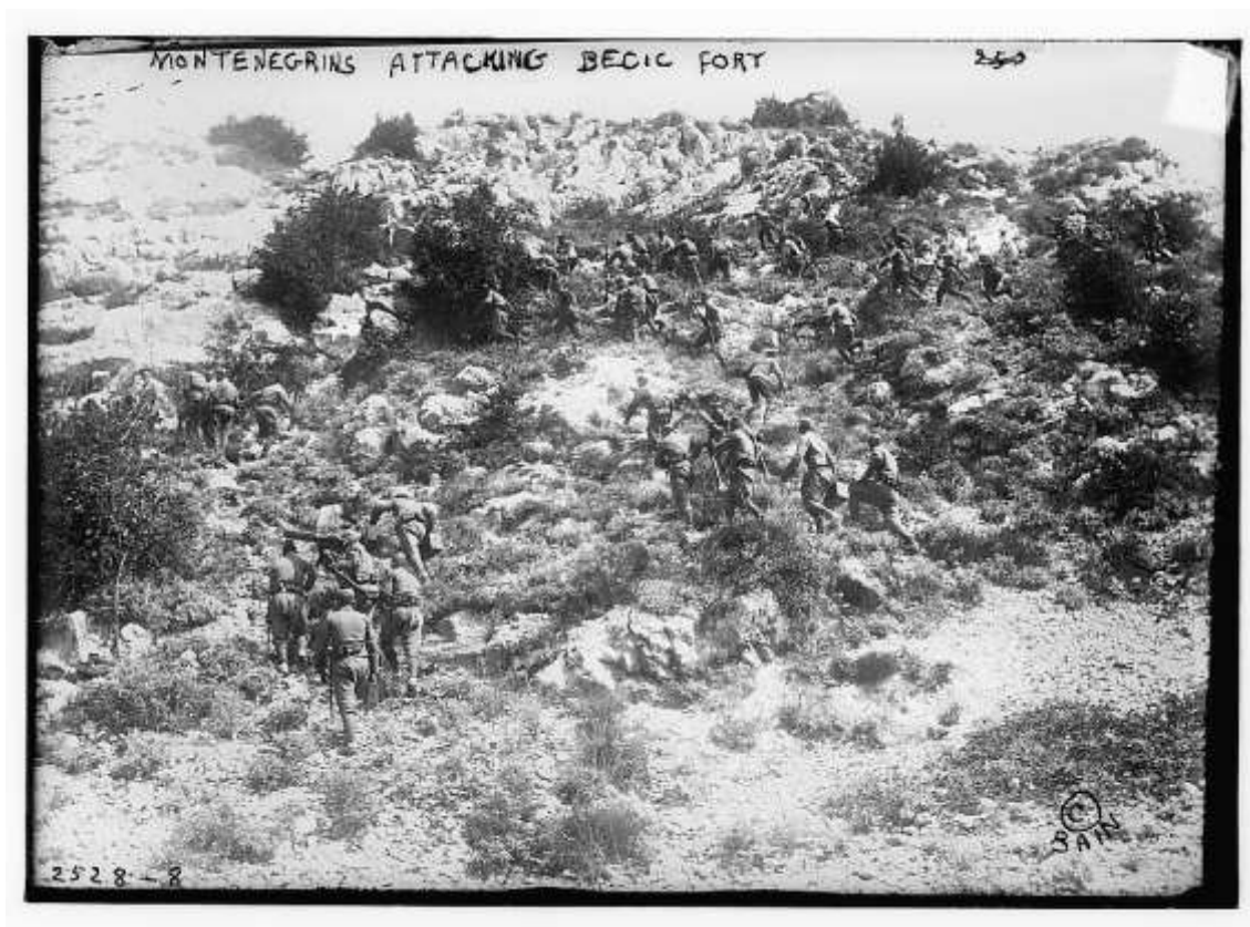
Asalto de fuerzas montenegrinas