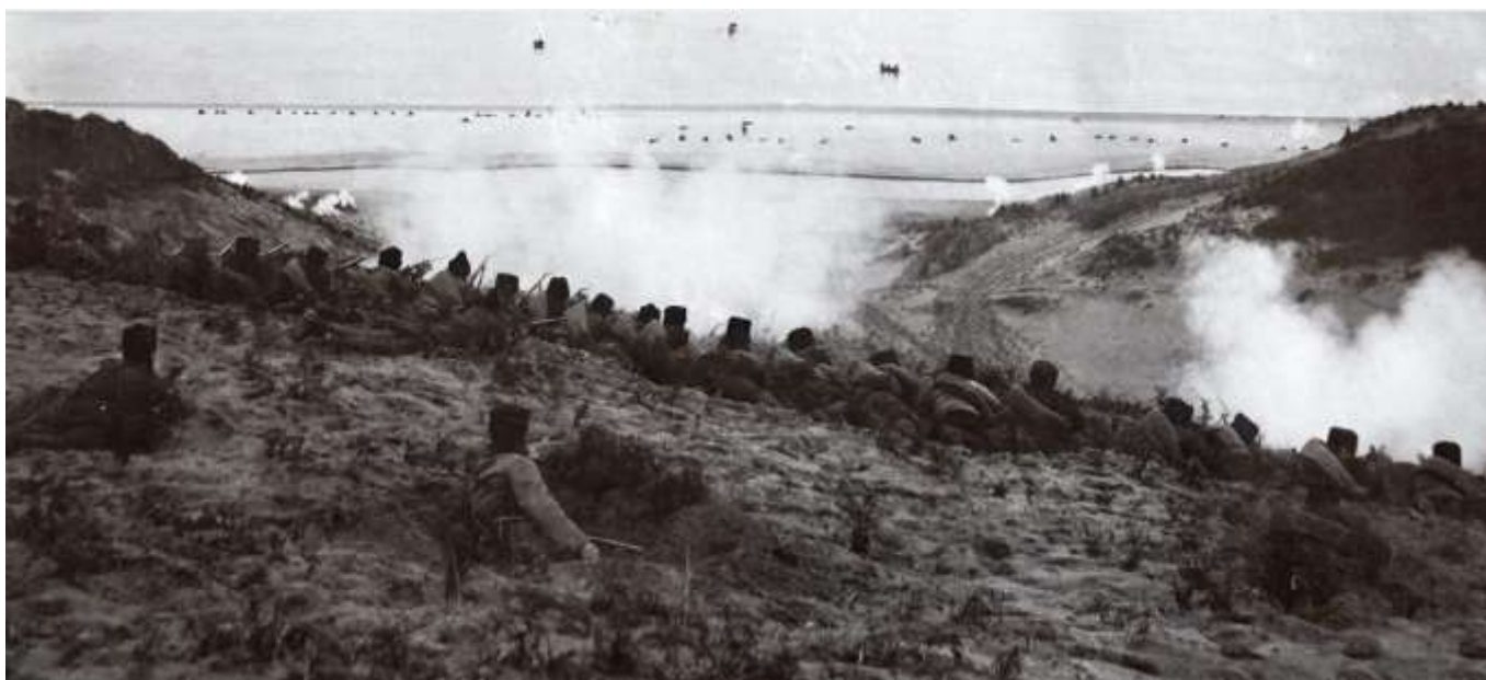
Soldados búlgaros repelen un desembarco turco en las orillas del Mar de Mármara, batalla de Bulair, 26 de enero de 1913