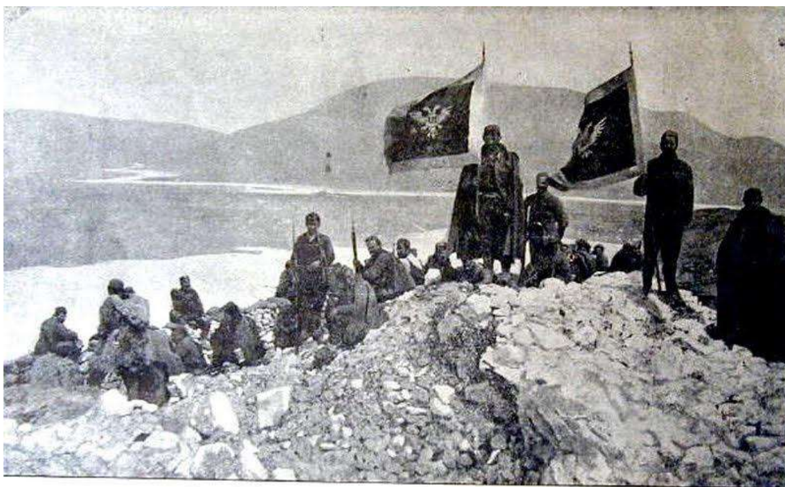
Дрвогорци на врху Тарабоша, поглед Скадру на Бојани

Soldados del Ejército Real de Montenegro, con sus banderas, descansando cerca de la confluencia de los ríos Taraboš y Skadra, cerca de Scútari, a principios de 1913