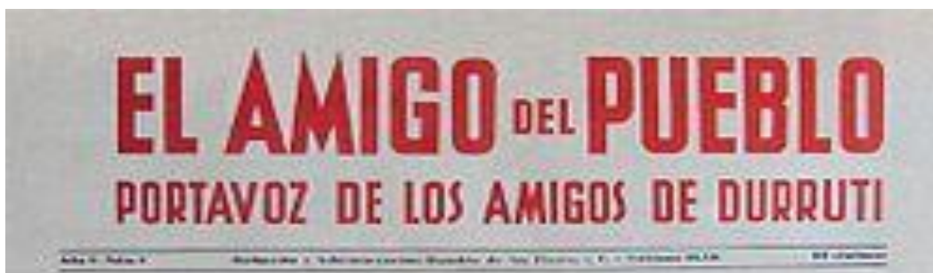
Imagen: cabecera de El Amigo del Pueblo . Portavoz de Los Amigos de Durruti

“Comentando a Durruti”. El Amigo del Pueblo , número 11. Barcelona, 20 de noviembre de 1937