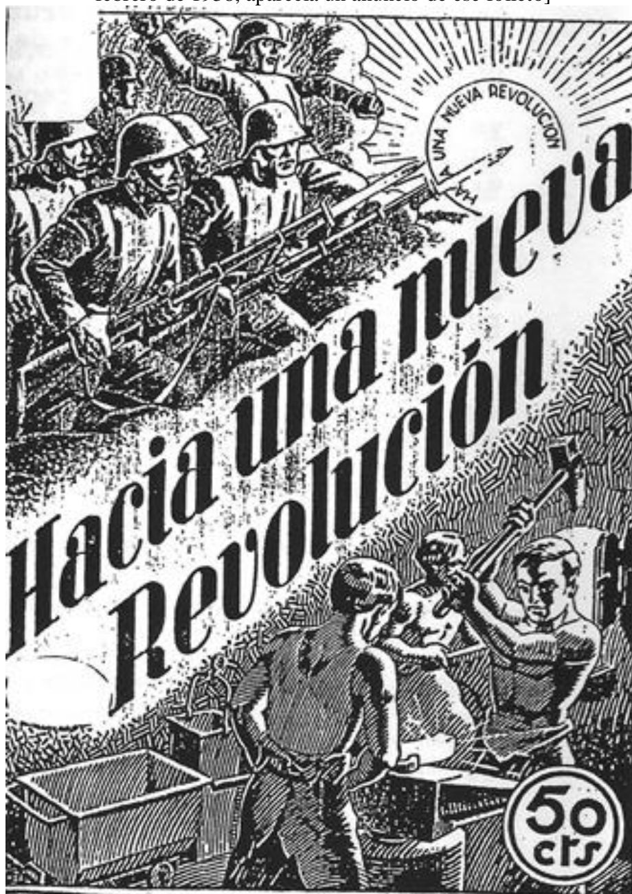
Imagen: portada de la primera edición del folleto Hacia una nueva revolución

[Folleto redactado hacia octubre/noviembre de 1937 y publicado probablemente en enero de 1938, puesto que en el número 12 de El Amigo del Pueblo , fechado el 1 de febrero de 1938, aparecía un anuncio de ese folleto]