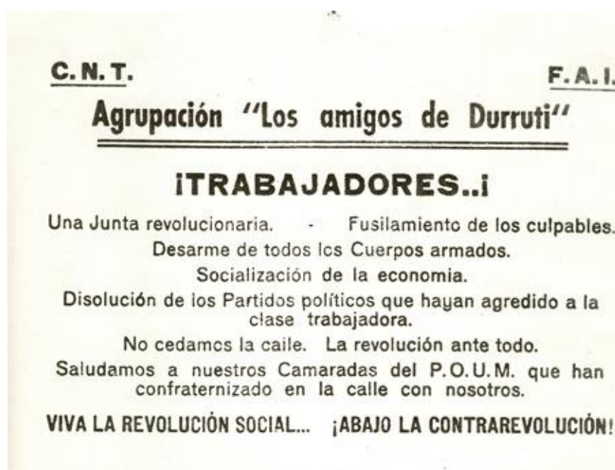
Imagen: octavilla de Los Amigos de Durruti distribuida en las barricadas de Barcelona, 5 de mayo de 1937

¡TRABAJADORES! Una Junta revolucionaria. Fusilamiento de los culpables. Desarme de todos los Cuerpos armados. Socialización de la economía. Disolución de los Partidos políticos que hayan agredido a la clase trabajadora. No cedamos la calle. La revolución ante todo. Saludamos a nuestros camaradas del POUM que han confraternizado en la calle con nosotros. ¡VIVA LA REVOLUCIÓN SOCIAL! ¡ABAJO LA CONTRARREVOLUCIÓN!”