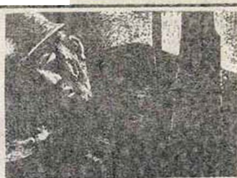
ELDA-PETREL. 25 de Febrero: