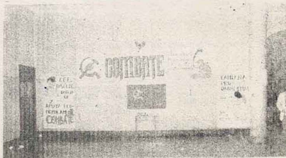
VENTA PUBLICA DE COMBATE EN LA UNIVERSIDAD DE LA LAGUNA (Canarias).